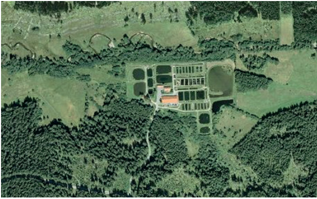
Abb. 3 - Luftbild / Orthophoto