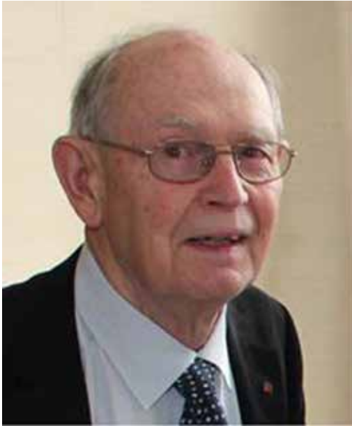
Foto: anlässlich Verleihung der Soldnermedaille 2012