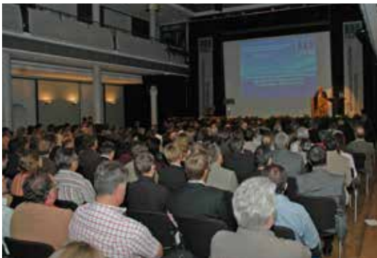
Fachwissenschaftliche Jahrestagung 2009

So zeigen z. B. die auf der Jahrestagung 2003 gehaltenen Vorträge „Förderung des ländlichen Raumes mit Hilfe der EU“, „Rheinland-Pfalz auf dem Weg zu ALKIS“ und „Satellitengeodäsie und Galileo“ auf das breite Spektrum der Berufsfelder hin.