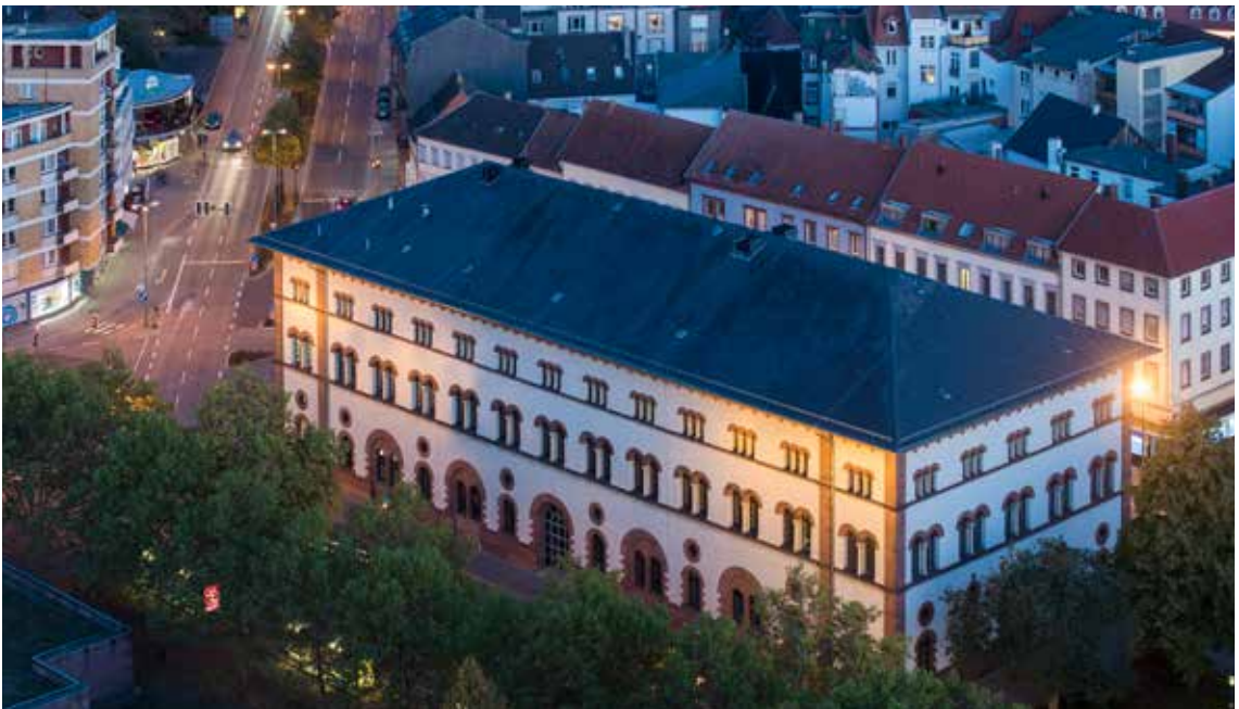
Fruchthalle in Kaiserslautern

Loos * Stumm * Elflein * Beus-Ganter * Heisser * Metzorf * Deußen * Tonollo