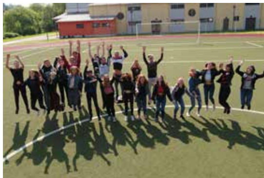
Drohnenfoto einer Schulklasse in Kusel

Unvergessen auch, was am Tag der Geodäsie 2019 in Kusel auf die Beine gestellt wurde. Elf Klassen und Kurse mit ca. 250 Schülerinnen und Schülern wurden erreicht und nahmen viele gute Eindrücke und Informationen in Sachen Geodäsie mit.