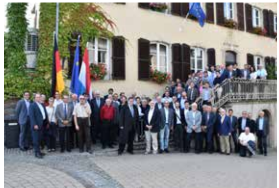
Kleiner Geodätentag 2016 in Schengen

Ein Mitunterzeichner dieser Verträge eröffnete die Vortragsreihe und brachte das Motto mit den Worten „Schengen ist Freiheit“ auf den Punkt. Nochmals Gänsehautfeeling.