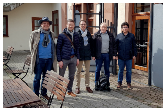
„Vorbereitungstreffen für den „kleinen Geodätentag“