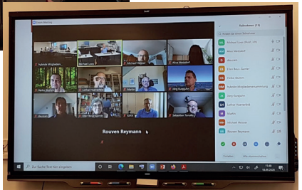
„Hybride Mitgliederversammlung am 18.09.2020“